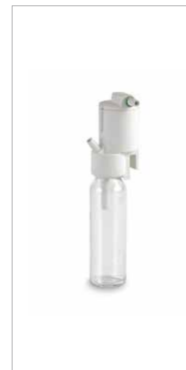
5 Артикул 444.0646.1