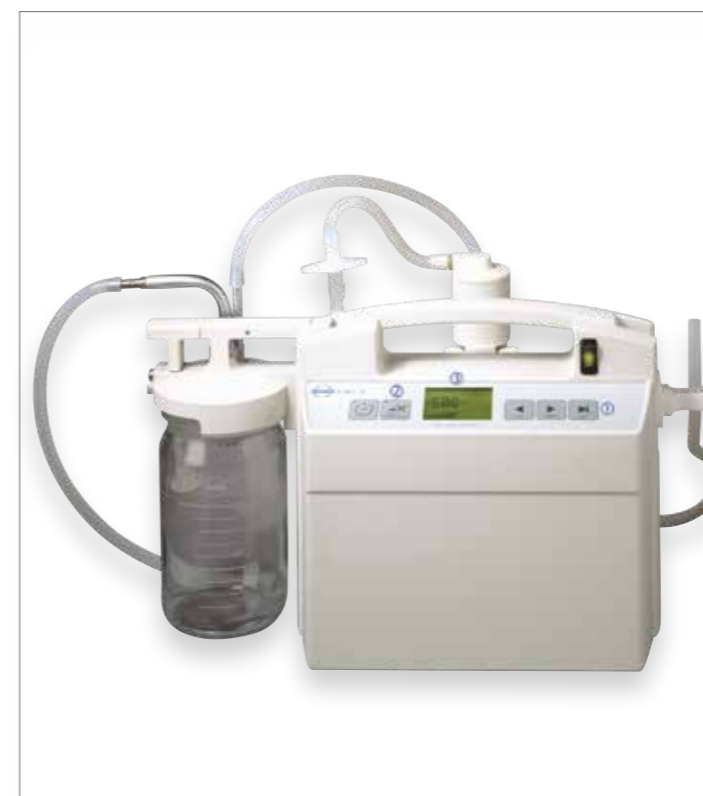
1 Артикул 444.0461.0