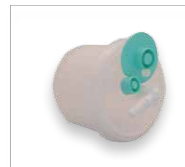
2 Артикул 340.0061.0