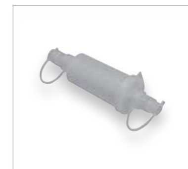
3 Артикул 401.0555.0