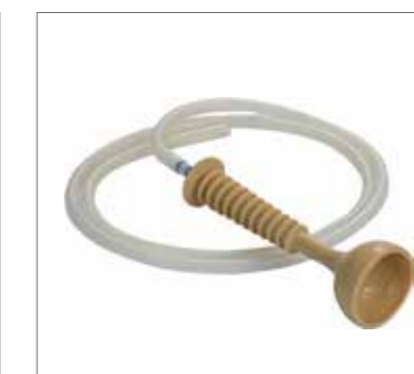
6 Артикул 404.0193.0