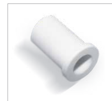
8 Артикул 340.0054.0