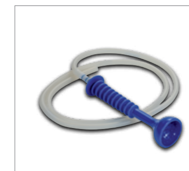
5 Артикул 404.0194.0