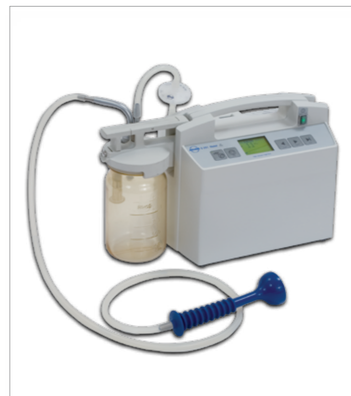
3 Артикул 444.0460.0