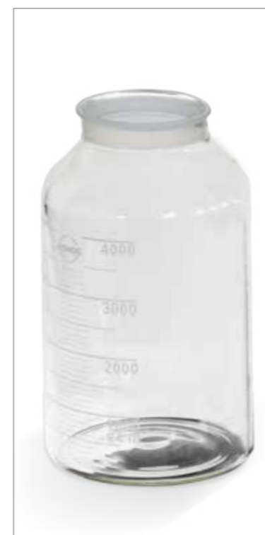
4 Артикул 444.0034.0