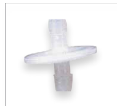
1 Артикул 443.0738.0