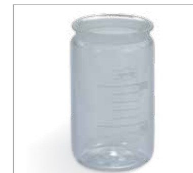
2 Артикул 444.0032.0