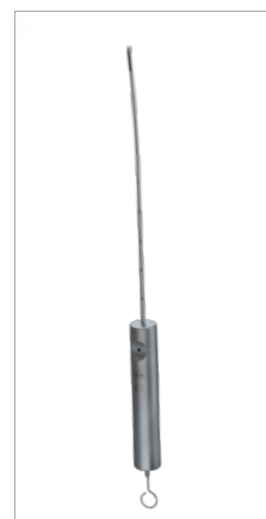
8 Артикул 401.0528.0