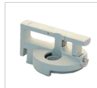
1 Артикул 444.0015.0