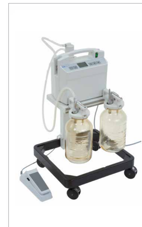
2 Артикул 444.0471.0