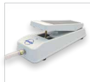
7 Артикул 444.0452.0