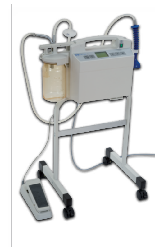
4 Артикул 444.0481.0