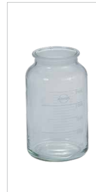
6 Артикул 444.0033.0