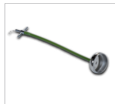
4 Артикул 404.0155.0