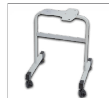
10 Артикул 320.0070.0