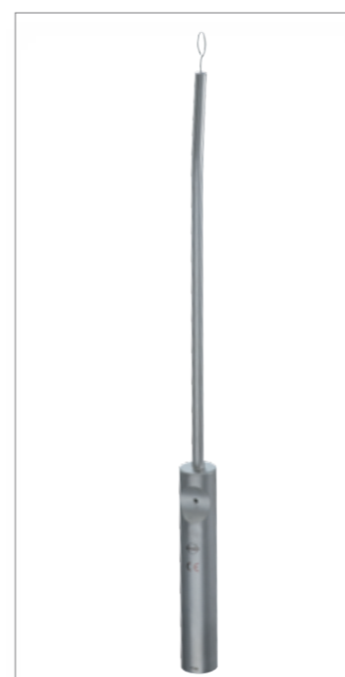
7 Артикул 401.0529.0